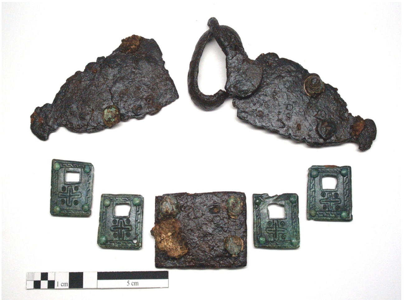
Abbildung 3: Gürtelgarnitur aus dem Männergrab 46, WW 119, nach der Restaurierung.