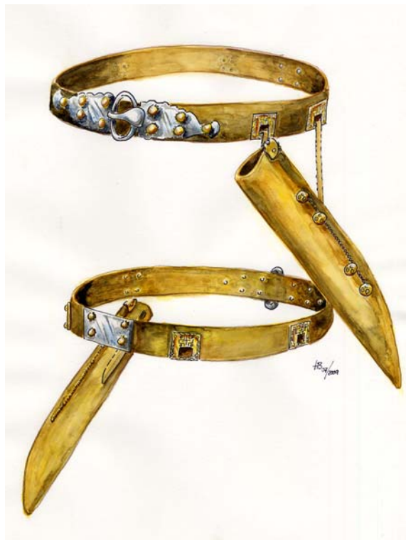
Abbildung 4: Rekonstruktionszeichnung der Gürtelgarnitur aus dem Männergrab 46. WW 119.