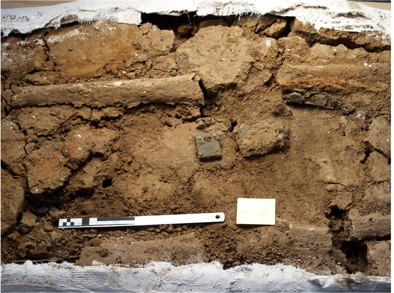
Abbildung 2: Blockbergung aus dem Männergrab 46, WW 119.