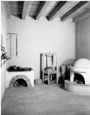
Augst: Die Küche des Römerhauses mit Herd, Handmühle und Backofen.

Koche Birnen, entkerne und zerstampfe sie. Mische sie mit Pfeffer, Kümmel, Honig, passum , liquamen und ein wenig Öl. Nach Zugabe von Eiern mache einen Auflauf, streue Pfeffer darauf und serviere.