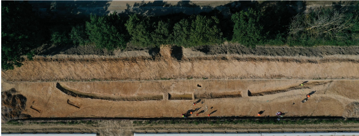
Abbildung 1: Drohnenbild gegen Ende der Grabungskampagne 2021. An zwei Stegen wurden zusätzliche Profile dokumentiert.